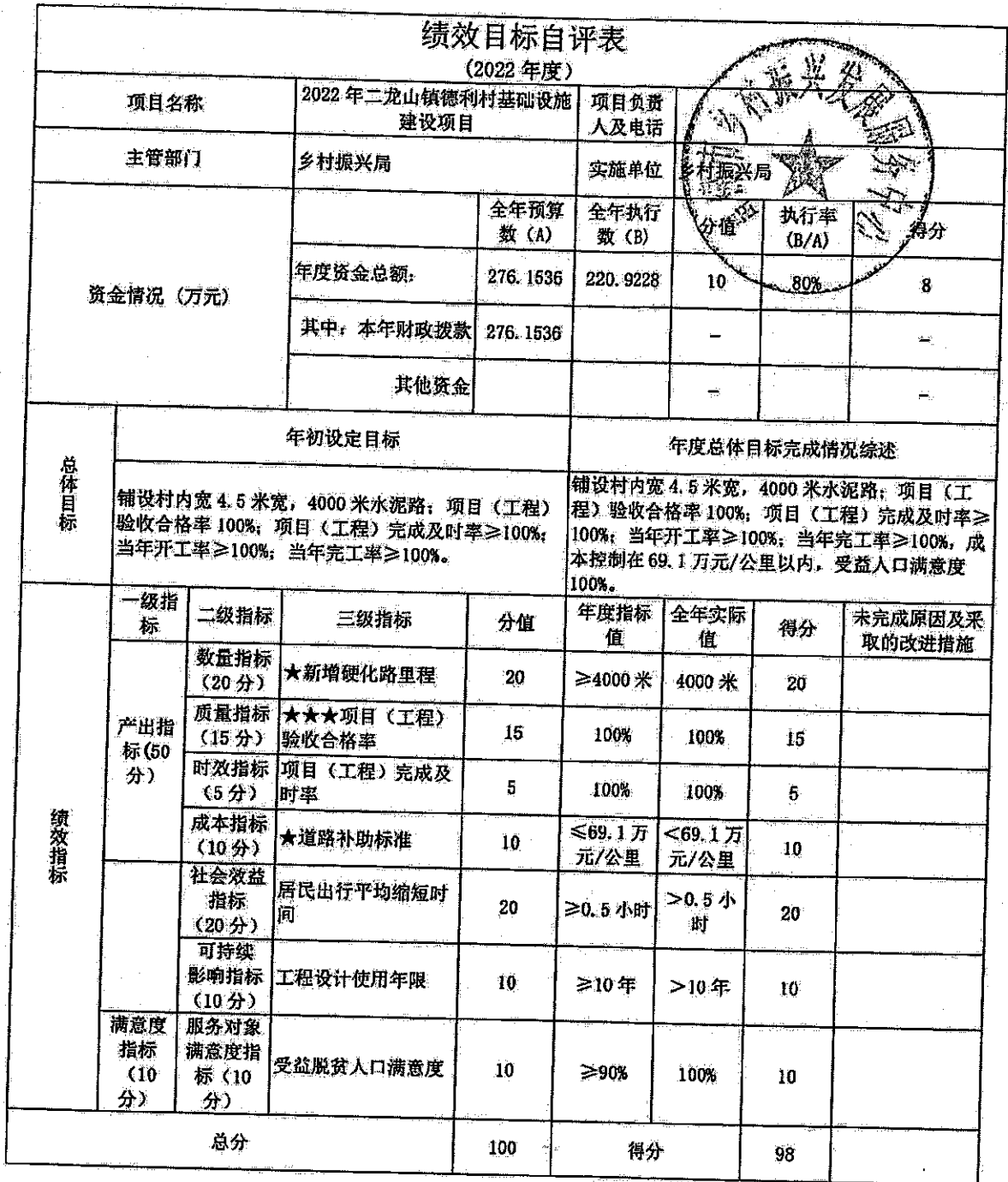
附件 1: 绩效目标申报表